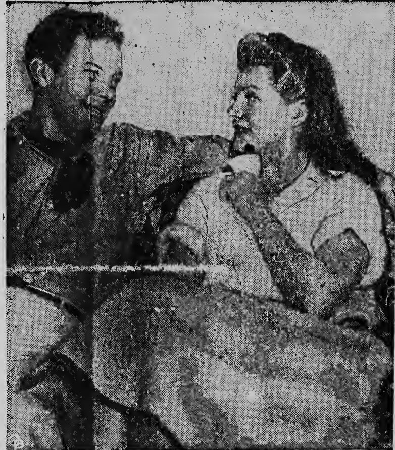
FILM STAR Rita Hayworth and her husband, singer Dick Haymes, relax in a Key West, Fla., hotel, where they admit they are more interested in fishing at the moment than in reports that her ex-husband, Prince Aly Khan, was expected to arrive. The legal issue involves a financial settlement for Yasmine, their daughter.

Tegen 23 uur was de receptie afgelopen en keerden de hoge gasten terug naar de hoofdstad.